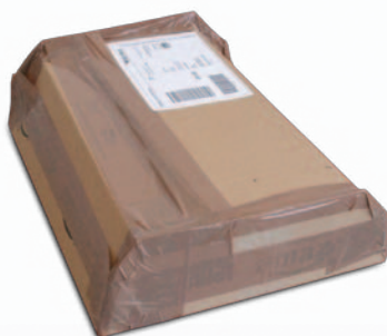
Sendungen mit geringer Abweichung der Quaderform (z.B. mit trapezförmigen Seitenflächen)