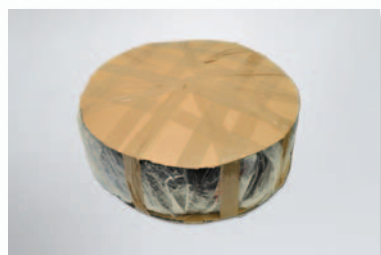
Nicht quaderförmig Beispiel: Reifen

Sperrgutsendungen bedürfen einiges an Mehraufwand, da sie aufgrund ihrer Form nicht maschinell sortiert werden können, sondern innerhalb der Hermes Umschlagsplätze und Niederlassungen manuell sortiert und transportiert werden müssen.