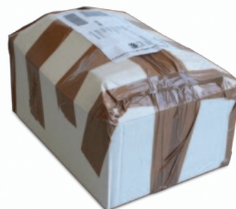
Sendungen mit leichten Wölbungen / Dellen