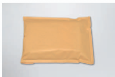
Umschlag Beispiel: Versandumschlag