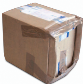
Sendungen mit abgerundeten Ecken

Folgende Sendungen sind aus diesem Grund ausdrücklich kein Sperrgut: