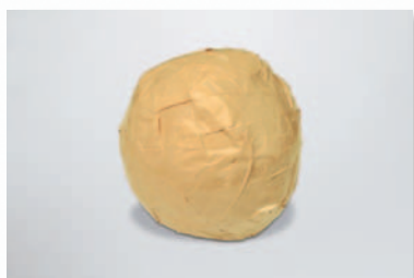
Nicht quaderförmig Beispiel: Ball