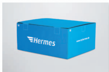
Quaderförmig Beispiel: Hermes-Kartonage