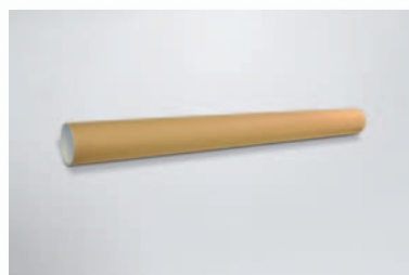
Paketrolle Max. 100 cm Länge, max. 20 cm Durchmesser

Die Paketklassen XL, XXL sowie die Produkte Sport- und Sondergepäck, Fahrräder (nur als Haustür-Abholung) und Reisegepäck sind von der Servicegebühr für Sperrgutsendungen ausgenommen.